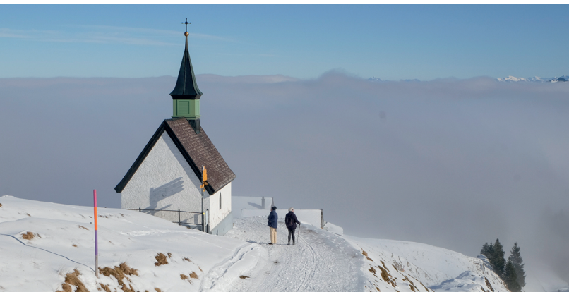
Noch immer auf dem Grat, doch bald im Nebel. Auf 1434 m ü. M. bei der 1859 errichteten Jakobskapelle.

Hotel Jakobsbad, 071 794 12 33, www.hotel-jakobsbad.ch