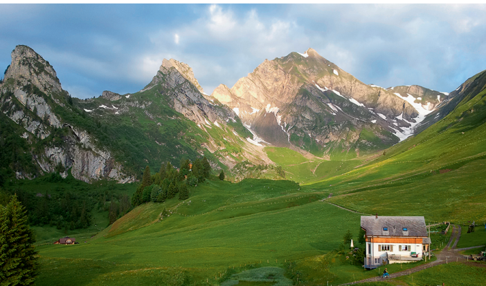
Der Hof Kneiwies liegt wunderschön auf einer Terrasse mitten in einer urigen Bergwelt. Rechts der Hoh Brisen (2413 m)

Bauernhof: www.kneiwies.ch , Schlafen im Stroh, Zimmer, Ferienwohnung, liegt am Weg Tourismus Wolfenschiessen www.tourismus-wolfenschiessen.ch Isenthal Tourismus www.isenthal.ch