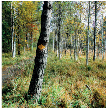
Im Vogelschutzgebiet La Golisse zu Beginn der Wanderung.