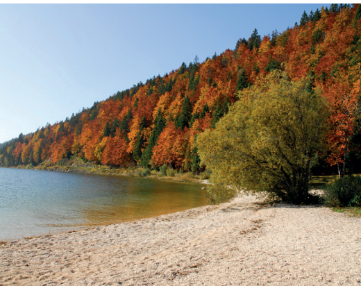
Kiesbänke ragen in den See hinaus und verlocken zum Verweilen und Spielen.

Hôtel & Restaurant Bellevue le Rocheray, 021 845 57 20, www.rocheray.ch