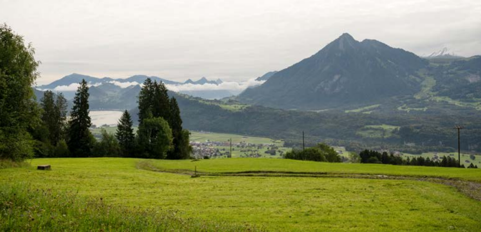
Aussicht vom Guber auf den Alpachersee und das Stanserhorn.