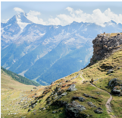
Im Abstieg nach Ferden: der Weg wechselt von steinig-alpin zu saftig-grün.