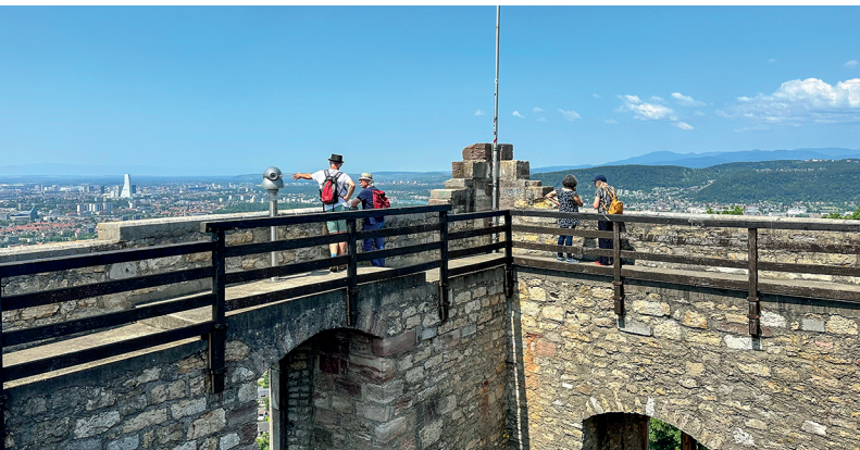
Die Aussicht vom Turm der Mittleren Burg Wartenberg ist grossartig.

Lindenbeizli Zum Schauenegg, 061 906 27 27, zumschauenegg.ch