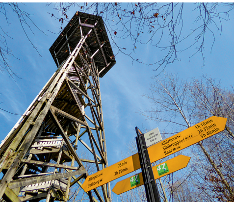
Aussicht vor den 152 Stufen auf die Albis-Hochwacht.

Wildnispark Zürich Sihlwald, Besucherzentrum, 044 722 55 22, www.wildnispark.ch Restaurant Albishorn, 044 764 01 67 www.restaurant-albishorn.ch Restaurant Sihlwald, 044 713 31 83 www.restaurant-langenberg.ch