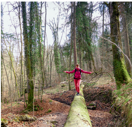
Spielerischer Abstieg durch den «Urwald».