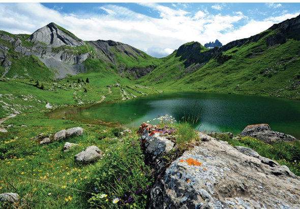
Die Gegend um das Sulsseewli gilt als Kraftort. Linkerhand thront der Ars und rechts hinten die Lohhörner.

Suls-Lohhornhütte, 079 656 53 20, www.lohhornhuette.ch