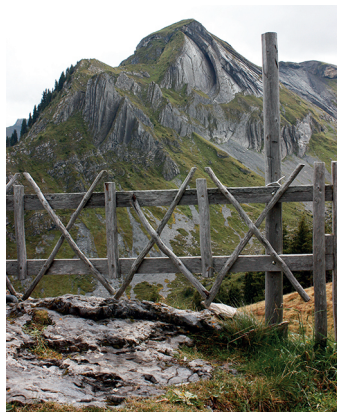
In der Flanke des Ars ist ein umgekehrtes Herz zu sehen.