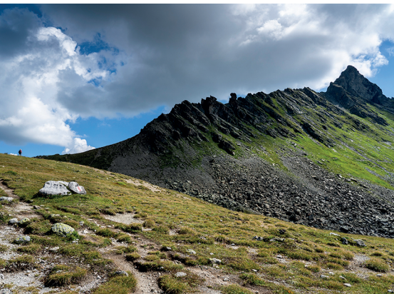
Beim Plassseggenpass mit dem Bergkamm beim Sarotlapass.

Berghaus Alpenrösli, 081 332 12 18, www.berghaus-alpenroesli.ch Tilisunahütte ÖAV, +43 664 1472 896, www.tilisuna-huette.at