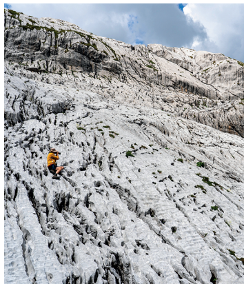
Fototermin im Karst der Wiss Platte.