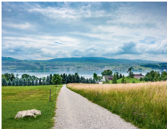
Zwischen zwei Beizen oberhalb von Stäfa; die Wanderung verläuft oft auf Feldwegen.