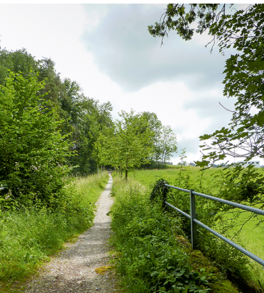
Geschichtsträchtig: das ehemalige Trasse der Wetzikon-Meilen-Bahn.

Restaurant Widenbad, 044 920 00 78, www.widenbad.ch Spiisbeiz Aberen, 044 926 11 31, www.aberen.ch Restaurant Frohberg, 044 926 15 50, www.frohberg-staefa.ch