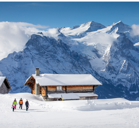
Der Hasliberg hat für jeden Geschmack etwas zu bieten: ruhige Winterwanderwege...

Bergrestaurant Käserstatt, 033 972 50 20, www.meiringen-hasliberg.ch