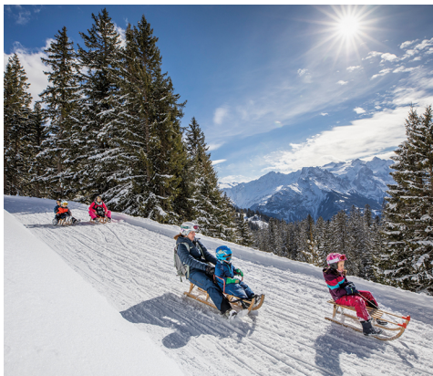
... oder rasante Abfahrten auf den Schlittelpisten.