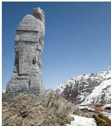
Der Adler auf dem Simplonpass erinnert an die Grenzbrigade 11.