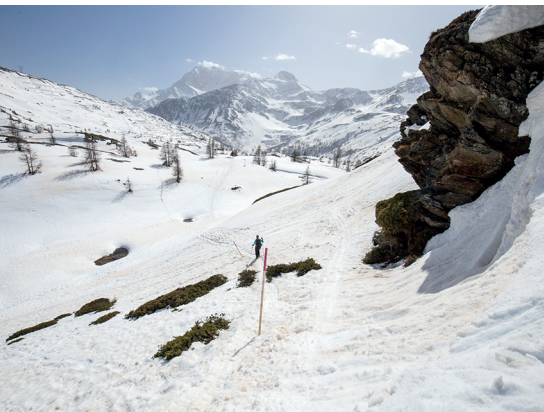
Mit den letzten lohnenden Blicken dem Ende dieser Tour entgehen.

Restaurant Monte Leone, 027 979 12 58, www.hotelmonteleone.ch Hotel Restaurant Simplon-Blick, 027 979 11 13, www.hotel-simplon-blick.ch Simplon-Hospiz, 027 979 13 22, www.simplon-hospiz.com Stiftung Geo Chávez, www.geochavez.ch