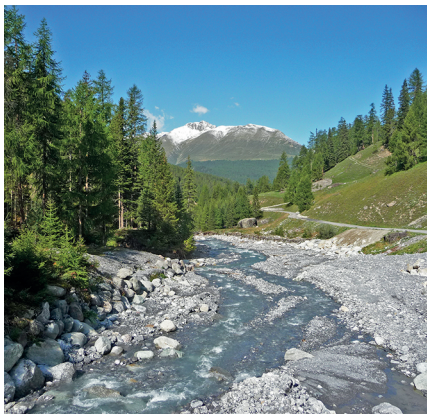
Punt da Val da Scrigns, Blick talauswärts.