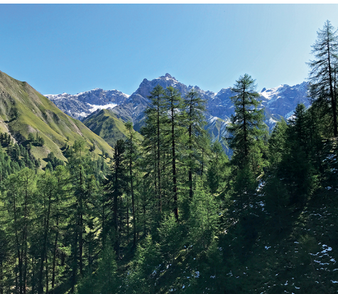
Blick ins Val Trupchun mit Piz Fier.

Erreichbar ist die Prasüras mit dem gelben Zügli «Express parc naziunal» oder in 30 Minuten zu Fuss ab S-chanf. Im Gebiet des Nationalparks ist das Verlassen der Wanderwege nicht erlaubt. Unbedingt einen Feldstecher mitnehmen! Einkehrmöglichkeiten in Prasüras und in der Parkhütte Varusch. Informationen zum Nationalpark: www.nationalpark.ch