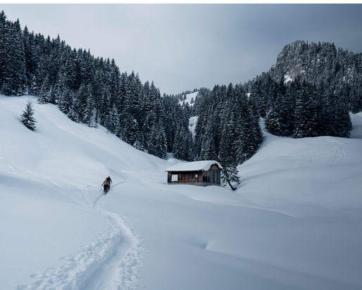
Blick auf den Zuezboden mit dem Sunnespitz im Hintergrund. Bilder: Jon Guler

Kerenzer Bergbahn (Filzbach Sessellift), 055 614 16 16, www.kerenzerbergbahn.com Bergrestaurant Habergschwänd, 055 614 16 16, www.kerenzerbergbahn.com/berggasthaus