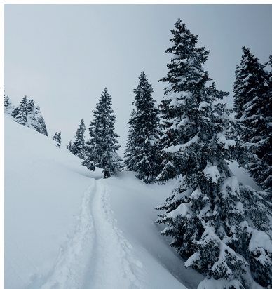
Die letzte Passage vor dem höchsten Punkt, Unter Nüen.