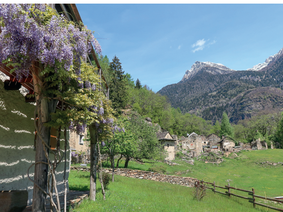
Die Ruinensiedlung Selva Piana, die bis 1900 bewohnt war.

Bed & Breakfast Casa Merogusto, Malvaglia, 091 870 13 00, www.meretbissegger.ch