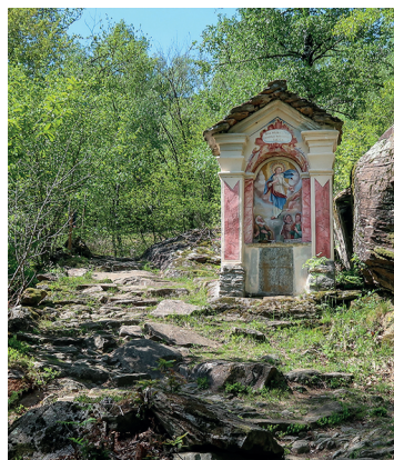
Bildstock zwischen Ludiano und Selva Piana.