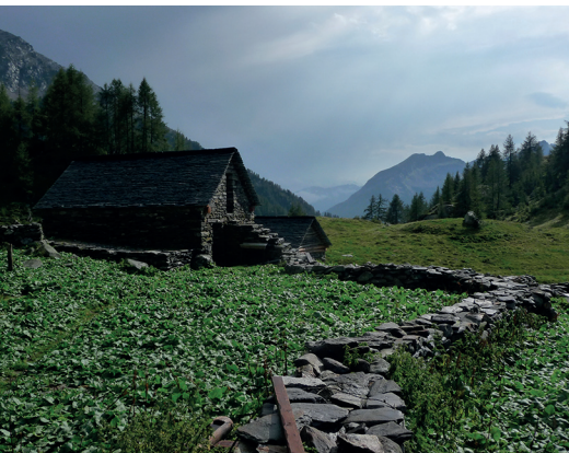
Harmonisch eingebettet in die Landschaft liegt diese Alphütte Corte Mognola.

Erreichbar ist Fusio mit dem Bus ab Locarno via Bignasco. Ufficio turistico Vallemaggia, 091 759 77 26, www.vallemaggia.ch