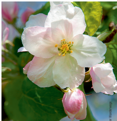
Und bis im Herbst wird daraus ein Apfel!