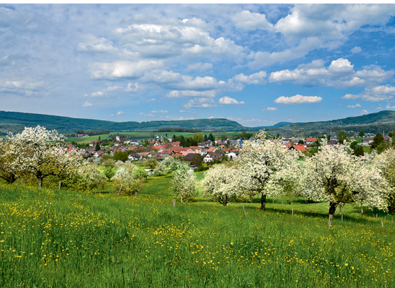
Mitten im Laufental, mitten im Frühling: das Dorf Brislach.