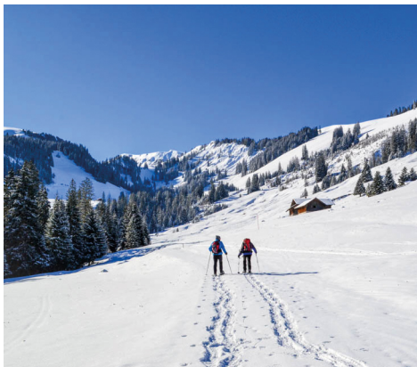
Auf dem verschneiten Alpsträsschen kurz vor Schwändli. In der Ferne sieht man das Niderhorn.