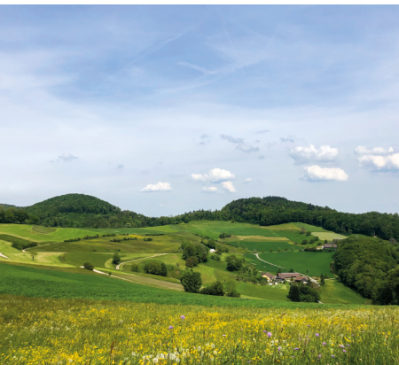
Der Jurapark Aargau besticht mit seiner lieblichen Landschaft.

Mehr zur Linner Linde auf: www.linnerlinde.ch