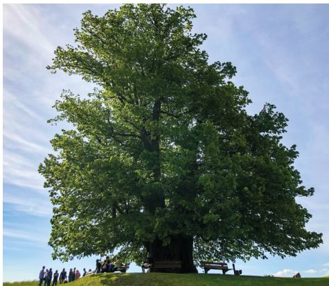
Die imposante Linner Linde, fast schon eine Berühmtheit.