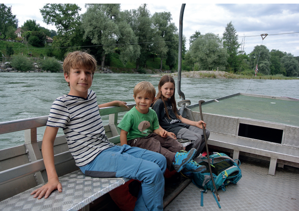
Mit der Fähre nach Bremgarten übersetzen.