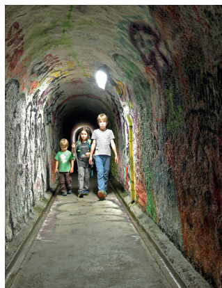
Zum Schluss wartet ein farbiges Tunnel.