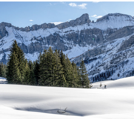
Kleiner Schneeschuhwanderer vor grossen, schattigen Felswänden.

Restaurant du Pillon: Tel. 024 492 10 00, www.col-du-pillon.ch