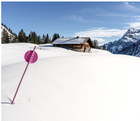
Die Alphütte von Le Rard mit dem Spitzhorn im Hintergrund.