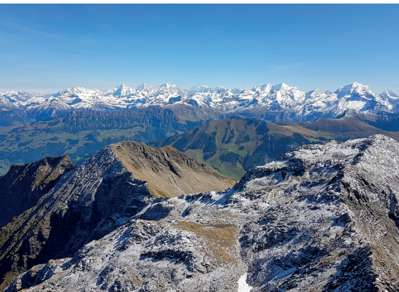
Der Blick reicht bis zu den Zentralschweizer Alpen. In der Bildmitte Eiger, Mönch und Jungfrau.

Restaurant Eggli, Grimmialp, 033 684 00 17, egglicschwenden.ch Hotel Restaurant Spillgarten, Grimmialp, 033 684 12 84, hotelspillgarten.ch