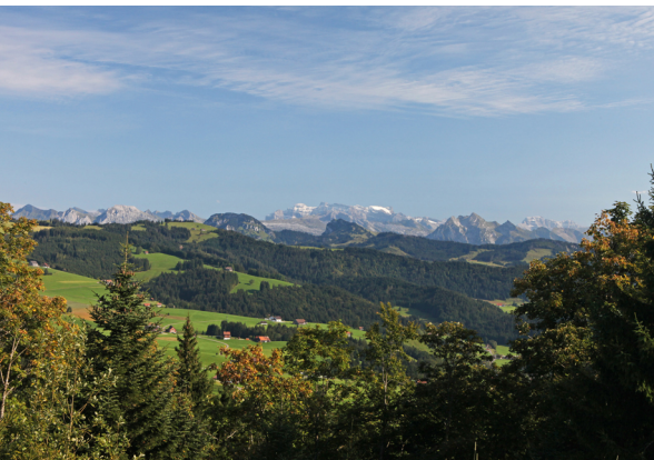
Blick Richtung Glärnisch.

Erreichbar ist Richterswil mit dem Zug ab Zürich.