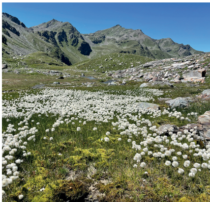
Auf dem Obers Fulmoos lässt es sich prächtig faulenzeln.