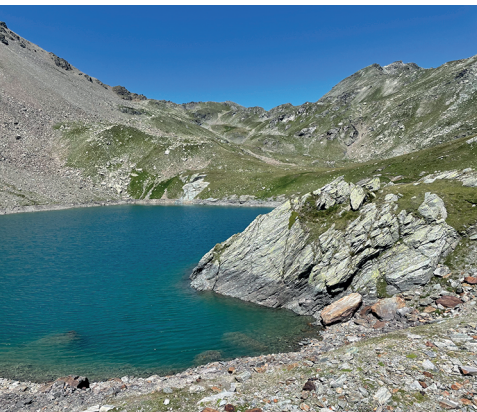
Der Sirwoltu Weiher, im Hintergrund der Sirwoltusattel.

Hotel Restaurant Rothorn Visperterminen, 027 946 30 23, www.hotel-rothorn.ch