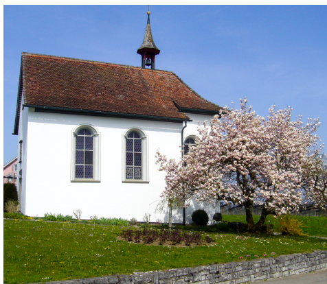
Mit der Kapelle Ruggisberg löste der Abt des Klosters Obermarchtal an der Donau ein Gelübde ein.