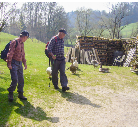
Die Gänse bewachen das Grundstück wie ein Hofhund.

Restaurant Erlenholz Wittenbach, Montag Ruhetag, 071 298 45 54, www.erlenholz.ch St.Gallen-Bodensee Tourismus, 071 227 37 37, www.st.gallen-bodensee.ch