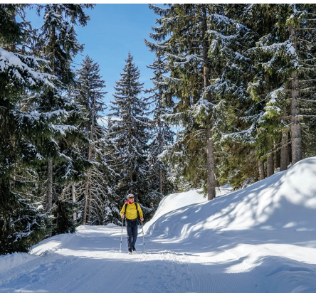
Ein lauschiger Waldabschnitt etwa in der Hälfte des Aufstiegs.

Erreichbar ist «Verbier, Crettaz Côté» mit dem Bus ab Le Châble. Zurück wieder mit dem Bus oder mit der Gondelbahn ab Verbier TV. Bergrestaurant Le Namasté, 027 771 57 73, www.namaste-verbier.ch/restaurant Bergrestaurant La Marmotte, 027 771 68 34, www.lamarmotte-verbier.com