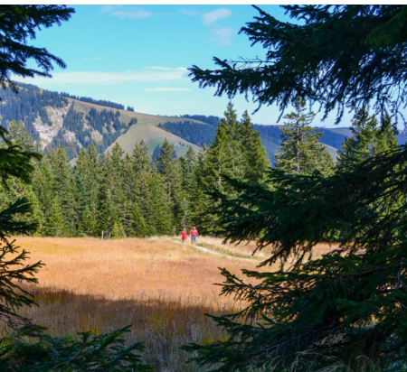
Auf schmalen, gewundenen Pfaden quert man Wälder und farbige Moorlandschaften.

Infos zu den Gasthäusern auf der Schwägalp, www.saentisbahn.ch Chammhaldenhütte, 071 351 66 88, www.sac-saentis.ch