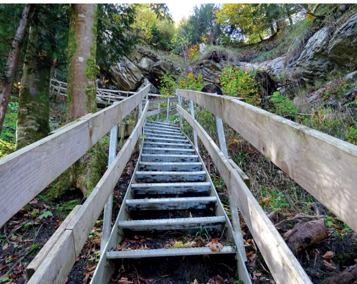
Treppen und Stege führen sicher durch tiefe Tobel in Appenzell Ausserrhoden.

Landgasthaus Rössli, 071 367 12 15, www.roessli-hundwil.ch