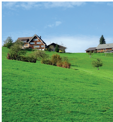
Der zweiten Teil der Wanderung führt über sanfte Hügel.