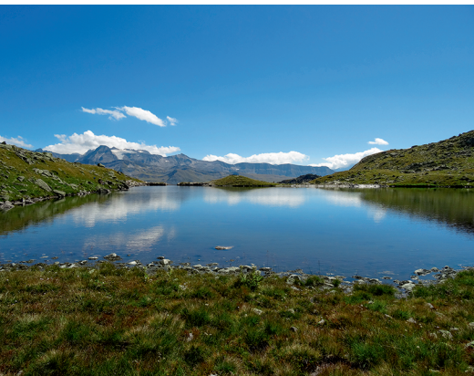
Tolle Aussicht beim Spilsee.

Bellwald Sportbahnen, 027 971 19 26, www.bellwald.ch Berrghütte Fleschen, 027 971 01 75, www.berghuettefleschen.ch