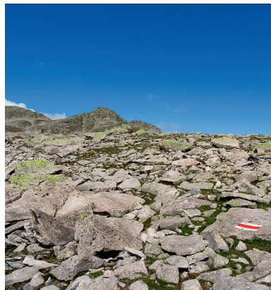
Suchbild: wie viele Bergwanderweg - Markierungen sind auf dem Foto?