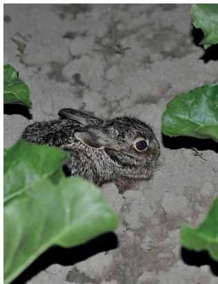
Die Junghasen verstecken sich in Äckern vor Fressfeinden.