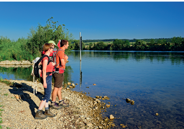
Geprägt von der Aare: Die Selzacher Witi ist ein stimmiger Ort für eine Feierabendwanderung.

Wirtschaft Zum Grüene Aff, Altreu, 032 641 10 73, www.zumgrueneaff.ch