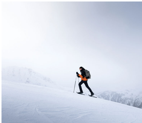
Während der ganzen Wanderung befindet man sich inmitten der Bündner Bergwelt.