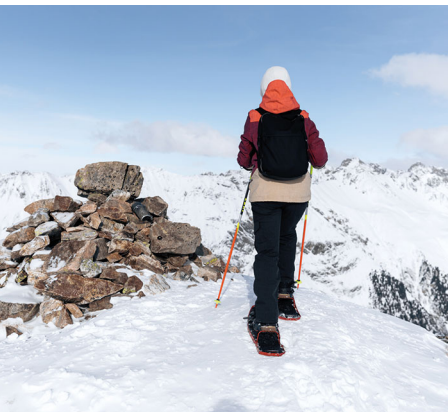
Ankunft auf dem Gipfel des Piz Darlux.

Bergün Filisur Tourismus, 081 407 11 52, berguen-filisur.graubuenden.ch/de Restaurant La Diala, 081 407 12 55, www.ladiala.ch