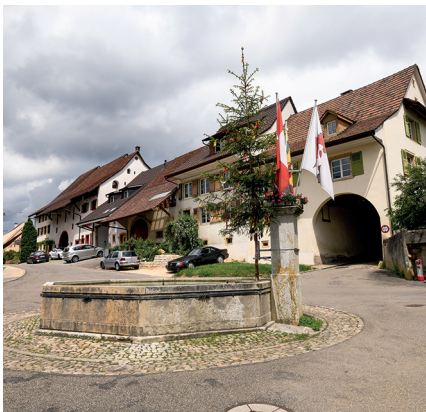
Die Maitanne beim Dorfbrunnen von Wenslingen ist mit Bändern geschmückt.