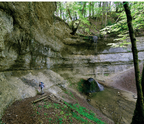
Der Giessenfall gibt Einblick in die Geologie des Tafeljuras.

Gasthof Löwen Rünenberg, 061 981 21 01, www.loewen-ruenenberg.ch Leimenstübli Wenslingen, 061 991 00 80, www.leimenstuebli.ch Restaurant Rössli Rothenfluh, 061 991 01 89, www.roessli-rothenfluh.ch