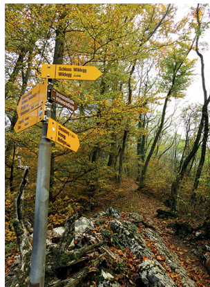
Es geht auf einen Berg, doch die Steigungen halten sich im Rahmen.