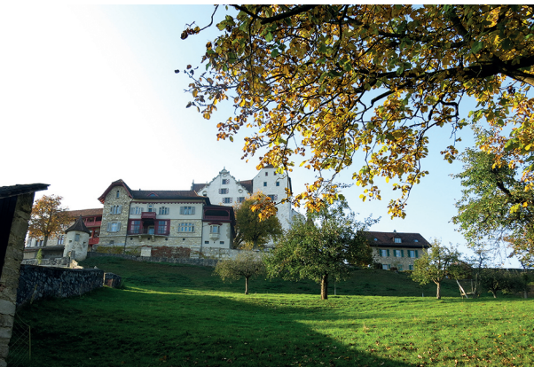
Am Ende des Chestenbergs liegt Schloss Wildegg.