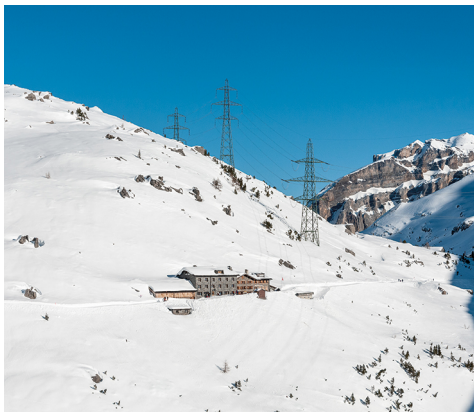
Das Berghotel Schwarzenbach ist in Sicht.