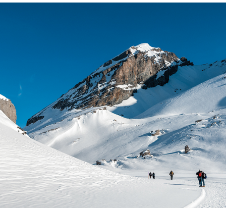
Am Ende des Daubensees biegt der Weg unter dem Chli Rinderhorn in eine Engstelle ein.

Berghotel Wildstrubel, Gemmipass: Tel. 027 470 12 01, www.gemmi.ch Berghotel Schwarzenbach: Tel. 033 675 12 72, www.schwarzenbach.ch