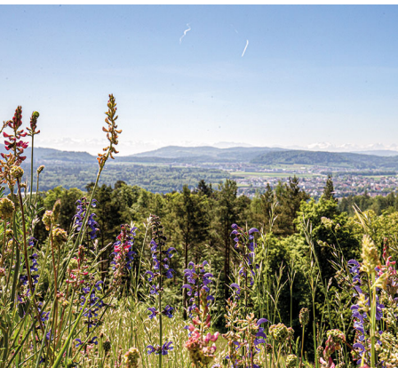
Auf den Wiesen blühen Salbei und Co.

Mehrere Einkehrmöglichkeiten in Wildegg, Auenstein und Küttigen.