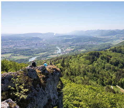
Von der Gisliflue aus hat man die Aussicht von Aarau bis zu den Alpen.