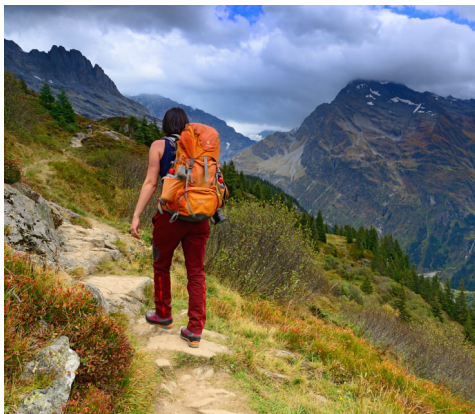
Aufstieg zur Windgällenhütte.