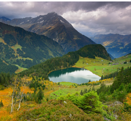
Der Golzernersee mit der Alp Seewen.

Windgällenhütte (AACZ), 041 871 28 19, www.windgaellenhuette.ch Gasthaus Golzernsee, 041 883 11 56, www.golzernsee.ch Luftseilbahn Golzern, 041 883 12 70