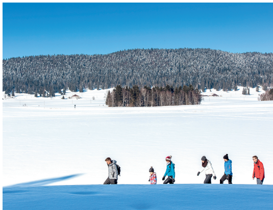
Unterwegs auf der weissen Hochebene von La Brévine.