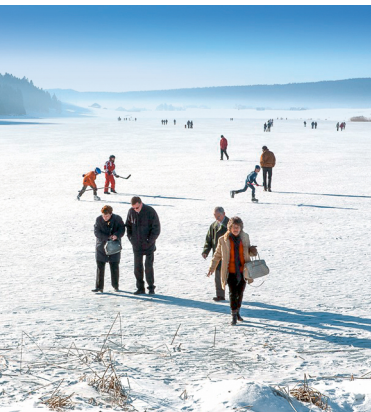
Der zugefrorene Lac des Tailières.

Auberge Au Loup Blanc, La Brévine, 032 938 20 00, www.loup-blanc.ch