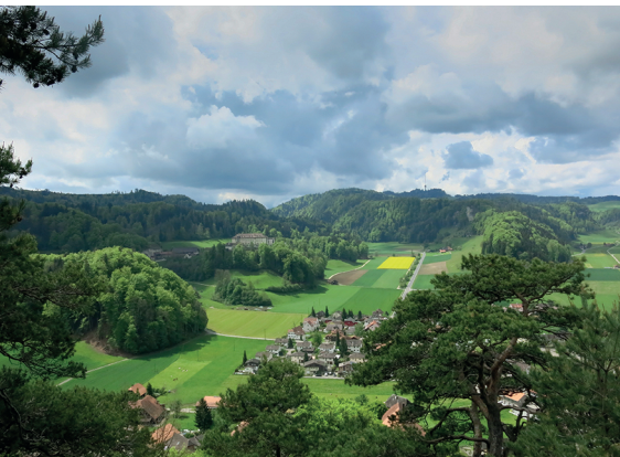
Aussicht von der Chrützflue auf Krauchthal und die Strafanstalt Thorberg.

Erreichbar ist Krauchthal mit dem Postauto ab Hindelbank oder Bolligen. Der Zug von «Burgdorf Steinhof» fährt nach Burgdorf und Thun. Restaurant Hirschen, Krauchthal, 034 411 14 31, www.hirschen-krauchthal.ch Restaurant Rothöhe, Oberburg, 034 411 48 48, www.rothoeh.e.com Restaurant Steingrube Oberburg, 079 315 87 76, www.steingrube.ch Werkzeug kann beim Dorfmuuseumleiter Ulrich Zwahlen ausgeliehen werden, 034 411 10 40, Reservation nötig.