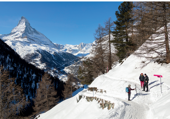
Während der Wanderung immer im Blickfeld: Das Matterhorn bestimmt die Aussicht.

Findlerhof, Findeln, 027 967 25 88, www.findlerhof.ch