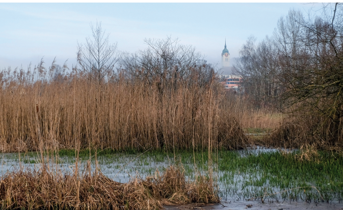
Winterliche Stille liegt über dem Hallwilersee und dem Dorf Hallwil.

Camping Seeblick Mosen, 041 917 16 66, www.camping-seeblick.ch