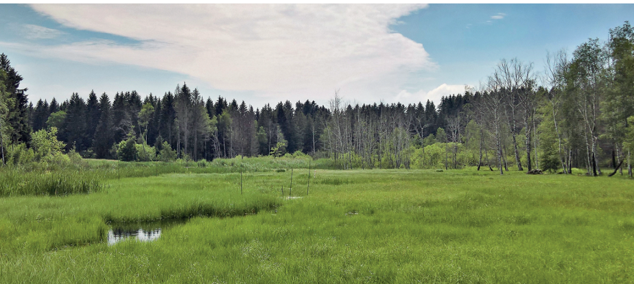
In der Moorlandschaft Les Mosses bei La Rogivue.

Erreichbar ist Châtel-St-Denis mit dem Zug von Bulle oder Palézieux. Ab Oron-la-Ville verkehren Busse nach Palézieux oder Romont FR.