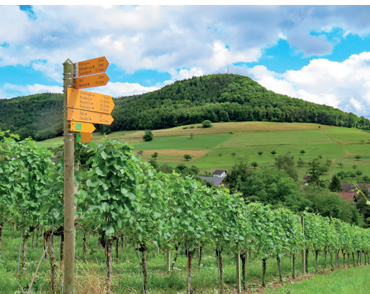
Über Weinberge geht es hinauf zum Spitz.

Gasthaus und Weingut Bad Osterfingen, 052 681 21 21, www.badosterfingen.ch Restaurant Rossberghof, Wilchingen, 052 681 10 63, www.rossberghof.ch Bergtrotte Osterfingen, 052 681 11 68, www.bergtrotte.ch