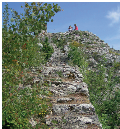
Die Ruine Radegg thront auf einem Felssporn.