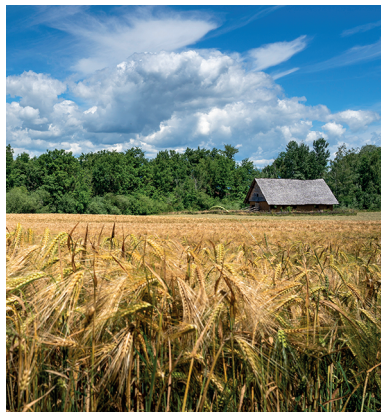
Bei Gletterens erfährt man im Pfahlbauerdorf vieles über früher.