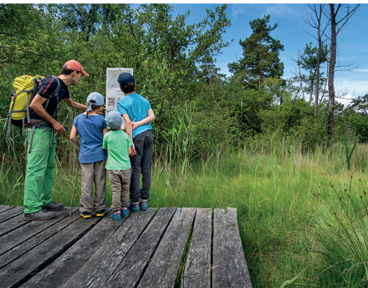
Staunen im Naturschutzgebiet Grande Cariçaie.

Village Lacustre, Gletterens, 076 381 12 23, www.village-lacustre.ch Restaurant Le Cygne, Gletterens, 026 667 10 80, www.restaurantlecygne.com Campingrestaurant La Nacelle, Portalban, 026 677 11 70, www.la-nacelle.ch Restaurant Le Bateau, Portalban, 026 677 11 22, www.le-bateau.ch