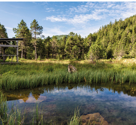
Malerische Szene beim Startpunkt der Wanderung.

Erreichbar ist «Glaubenberg, Passhöhe» mit dem Postauto ab Sarnen. Rückfahrt ab Sörenberg mit dem Postauto bis nach Flüeli (LU) mit Zugverbindungen nach Bern und Luzern.