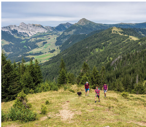
Am Haldimattstock.