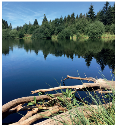
Der Etang des Royes ist einsamer als der nahe gelegene Etang de la Gruère.