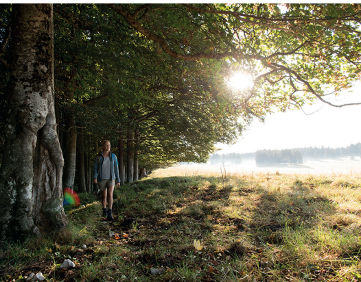
Das Morgenlicht begleitet die Wanderin durch die Freiberge.

Auberge de la Gare, Le Prépetitjean, 032 955 13 18, www.aubergedelagare.ch Restaurant Les Voyageurs, Le Petit Bois-Derrière, 032 955 11 71, www.restaurant-les-voyageurs.ch Café-Restaurant du Sapin, Les Rouges-Terres, 032 951 17 64