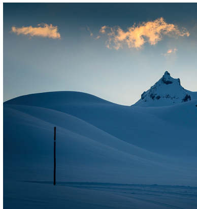
Schroffe Einsamkeit am Graustock, erlebt auf der Tannalp.