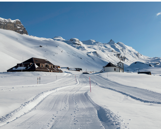
Am Ziel: die Alpsiedlung Tannalp mit Bergrestaurant.

Einkehrmöglichkeiten auf der Melchsee-Frutt: 041 669 70 60, www.melchsee-frutt.ch Berggasthaus Tannalp, 041 669 12 41, www.tannalp.ch