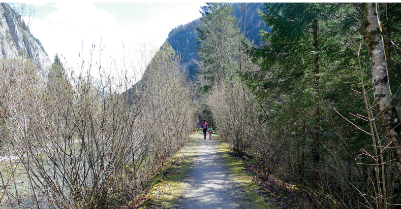
Auf dem ersten Abschnitt führt der Weg über den Damm der Simme.

HOF bar & snacks, Oey, 033 681 00 14, diemtigtal.ch/gastro/hof-bar-snacks