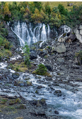
«Bi de sibe Brünne», die Quelle der Simme.

Kleine Alprestaurants auf den Alpen Ritz, Langermatte und Rezilbergli