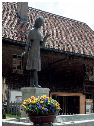
In Guggisberg wartet das Vreneli vor dem Museum.