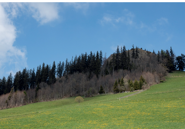
Der markante Nagelfluhfelsen des Guggershorns ist schon von Weitem zu sehen.

Vreneli-Museum, 078 847 27 10, www.vreneli-museum.ch