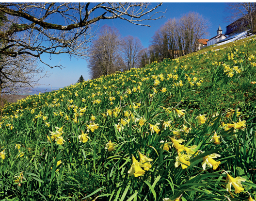
Kurz vor Roche-d'Or findet man ein grosses Feld voller gelber Narzissen.

Restaurant Le Cheval Blanc, Chevenez, 032 476 62 31, www.lechevalblanc-chevenez.ch Grotten von Réclère und Préhisto-Parc, 032 476 61 55, www.prehisto.ch