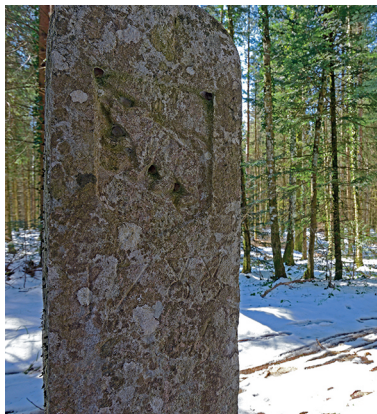
Der Grenzstein stammt aus der Zeit, als der Jura noch zum Staate Bern gehörte.